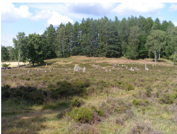
View over gravfeltet Vätteryd.

Feltet blev i perioden 1955-57 undersøgt af