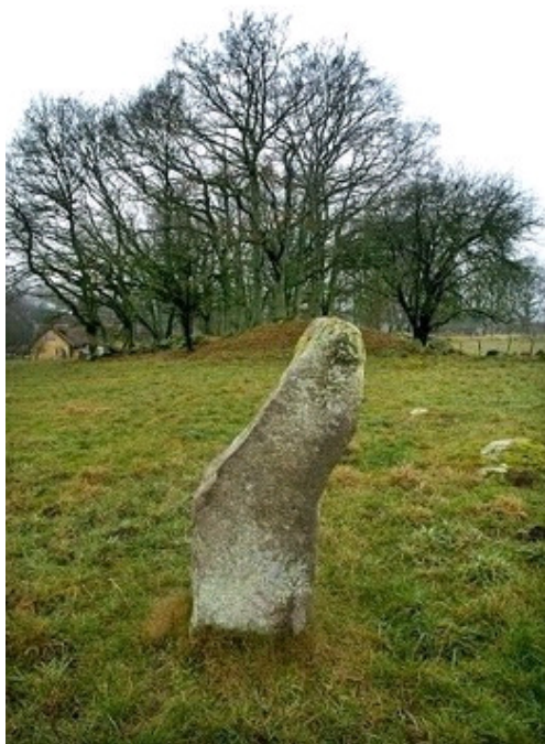
Bautasten fra gravfeltet i Gryt.

I Östra Göinge og Gryt sogn ligger et mindre gravfelt ca. 1 km syd for Gråstorp. Gravfeltet be-