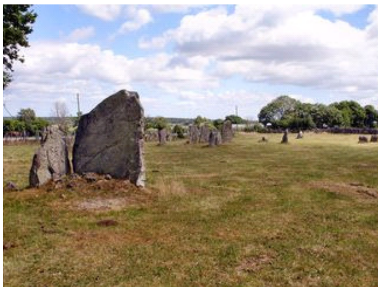
Gravfeltet Stainabjär i Åraslöv.