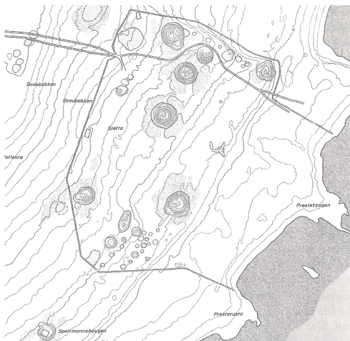
Borre gravfeltet med den trekantede grav i centrum af højene.

© 2011 - Karsten Krambs, version 1.3 - 8. Januar 2011.