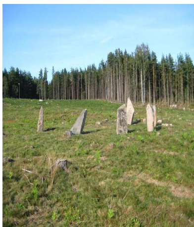
Stenring fra Opstad gravfelt.

En stor del af rund- og langhøjene indeholdt kulrester og brændte ben. Trekanten var fundtom. Fra udgravningerne i 1869 er oplyst gravfund som et tveægget jernsværd, en jernøkse og et kar af klebersten. Der er registeret flere fladmarksgrave.