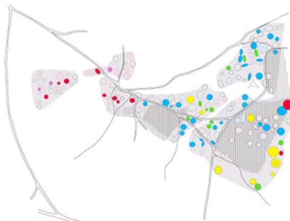
Skitse over Store-Dal gravfeltet. De farvemærkede høje er undersøgt.

Den trekantede høj med indbuede sider blev undersøgt i 1910 - men fundet tom. I hver af spidserne har der stået en bautasten - og muligvis også i midten - men ellers har det ikke været muligt at datere højen nærmere end til ynge jernalder .